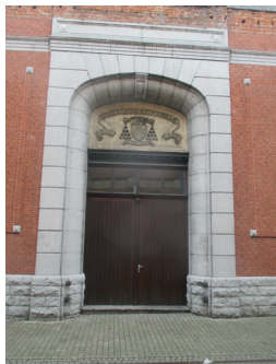
Poort 3 Kleuterafd. P. Snoeckstr.