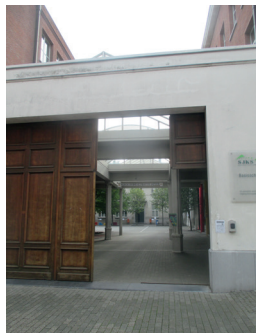
Poort 2 Lagere afd. P. Snoeckstr.