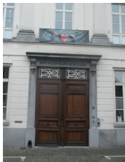
Poort 1 Hoofdpoort Collegestr. 31