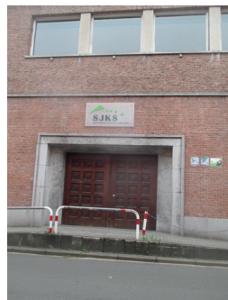
Poort 4 Humaniora V. Britsomstr.