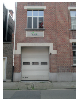
Poort 5 Parking Tiffany's V. Britsomstr.