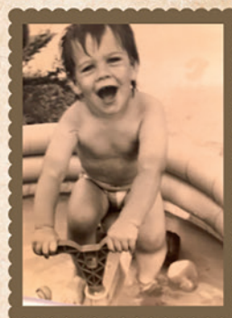
20 meester Vik