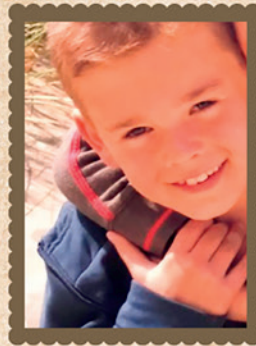
24 meester Arne