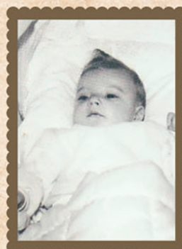
10 meneer directeur