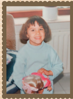
23 juf Anndies S